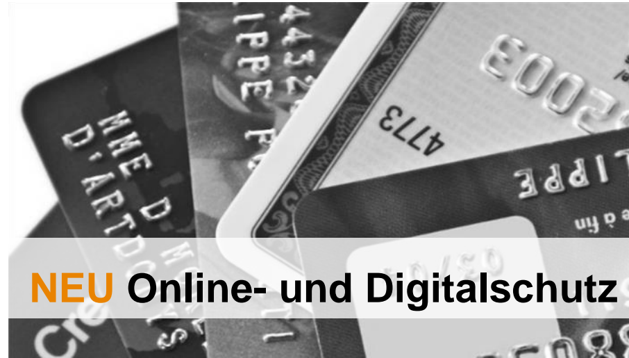
NEU Online- und Digitalschutz