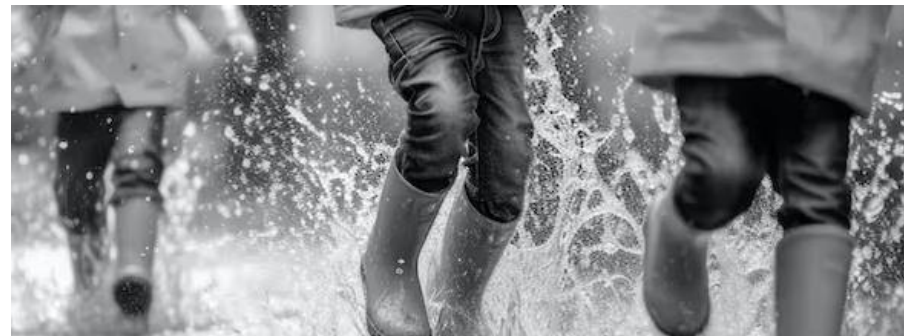
Elementar 1 oder 2