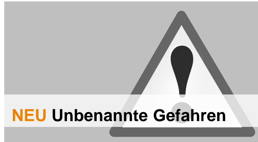
NEU Unbenannte Gefahren